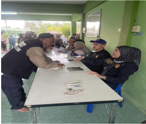
ภาพประชาคมหมู่ที่ ๑