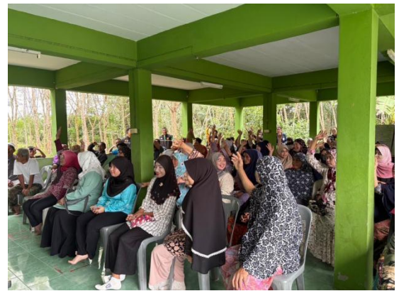
ภาพประชาคมหมู่ที่ ๒